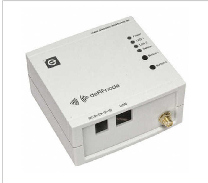
Image ကိုကိုယ်စားပြုခြင်းဖြစ်သည်။ ထုတ်ကုန်အသေးစိတ်သတ်မှတ်ချက်များကိုကြည့်ပါ။